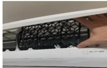
フィルターの形状に合わせ置くだけでOK