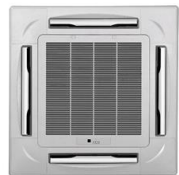
天井埋込型エアコン